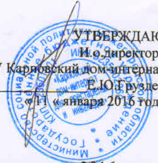
График проведения инструктажей по пожарной безопасности на 2016 год.